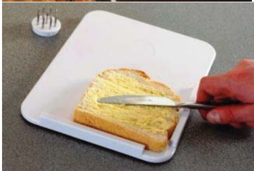
Planche à tartiner en matière synthétique avec pointes de fixation

La planche consiste en un socle et des bords fabriqués en une seule pièce. Les 9 pointes se trouvent dans un petit cercle qui s'insère dans la planche. Les pointes sont disponibles séparément. Dimensions : 18 x 25,5 cm. Poids : 190 gr. Résistant au lave-vaisselle (50°).