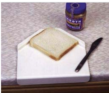
Planche à tartiner diagonale

Planche à tartiner en matière synthétique de 22 cm avec deux surfaces obliques à l'arrière, un petit bord à mettre sur le bord de la table à l'avant et des petits pieds antidérapants en dessous. Dimensions : 22 x 22 cm. Résistant au lave-vaisselle (50°).