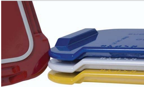
Planche à tartiner en mélamine

Planchette rectangulaire en matière synthétique, disponible en couleurs attrayantes. Fabriquée en mélamine lourde, la matière synthétique la plus solide.