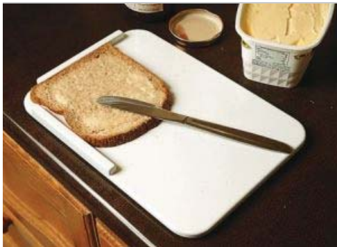
Planche à tartiner en matière synthétique

Planche rectangulaire en matière synthétique avec 2 bords. On place la planche, bords à droite pour les gauchers et à gauche pour les droitiers. Dimensions: 18 x 25,5 cm. Poids : 190 gr. Résistant au lave-vaisselle jusque 50°.