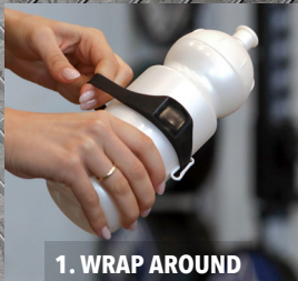
1. WRAP AROUND